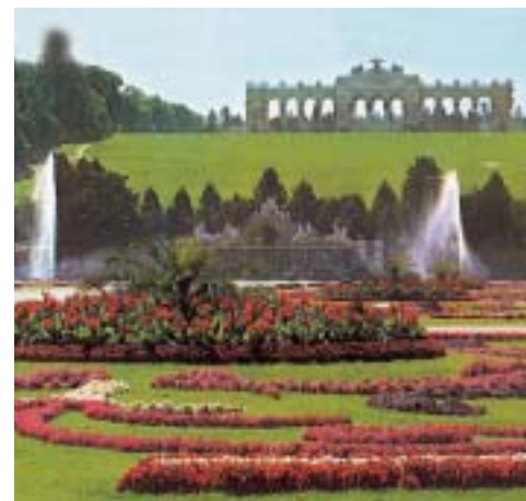
Vienna, Palazzo Schönbrunn (Gloriette)