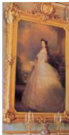
L'Imperatore Francesco Giuseppe I e la moglie Elisabetta